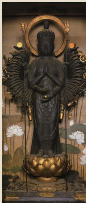
温泉寺本尊 十一面観音像

古来、温泉に入る人は必ず参拝し、入湯作法を授かった。歴史に触れて入浴するとご利益ありそう。見晴らし抜群で、春は桜も美しい。♣豊岡市城崎町湯島985-2 ☎0796-32-2669 ◎9:00～17:00 第2・4木曜休 ♡拝観料=大人300円 ◎城崎温泉駅から徒歩約20分、「城崎温泉」から城崎温泉ロープウェイ、「温泉寺」から徒歩すぐ