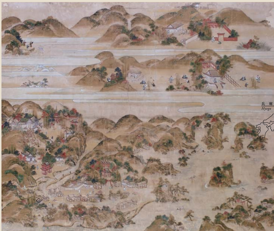
海北友竹筆「温泉寺縁起図」